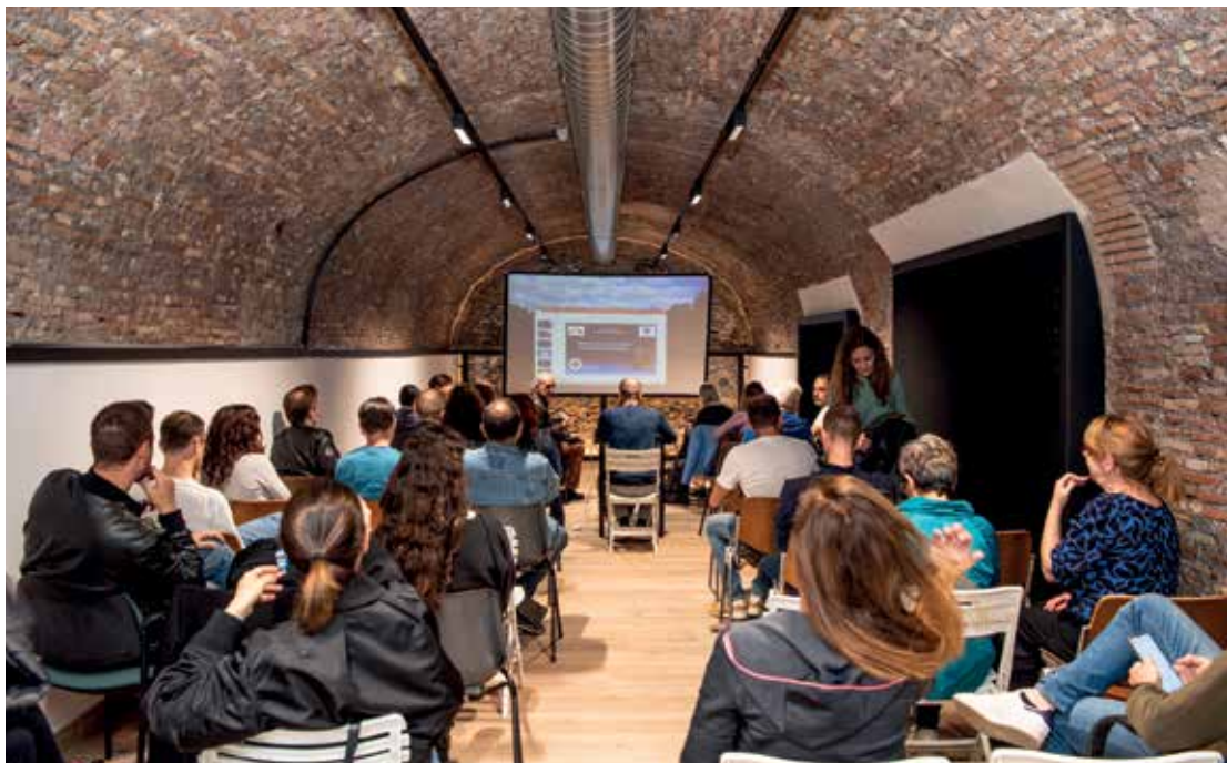
Una delle sale durante una lezione del Corso di Escursionismo base

L'esigenza di una sede di proprietà, più grande e strutturata, è perciò nata alcuni anni fa proprio in conseguenza di questa crescita che aveva portato a uno stato claustrofobico insostenibile nella vecchia sede di via Galvani. La nuova sede, o per meglio dire "La sede" del CAI di Roma che finalmente dopo 151 anni ne è proprietaria,