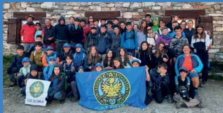
Il gruppo dell'AG al campo estivo presso il Rifugio de L'Épée in Valgrisenche