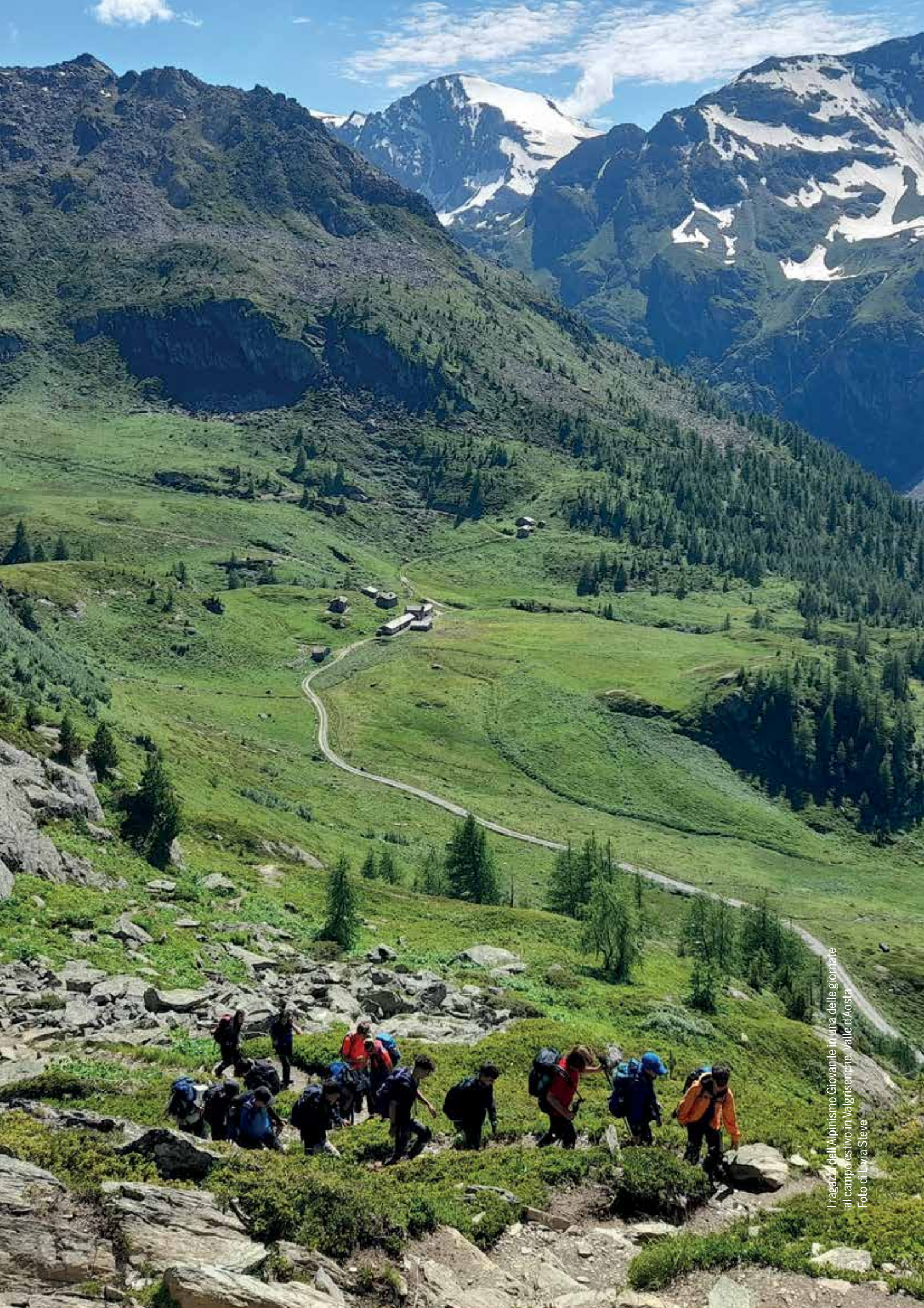
I ragazzi dell'Alpinismo Giovanile in una delle giornate al campo estivo in Valgrisenche, Valle d'Aosta