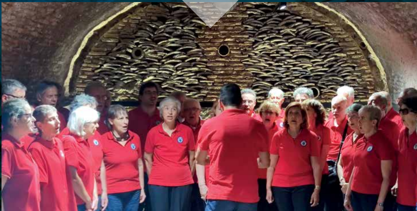
Il coro del CAI Roma