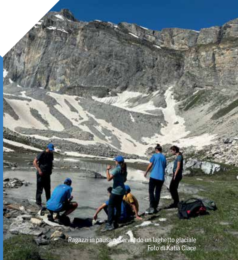
Ragazzi in pausa osservando un laghetto glaciale