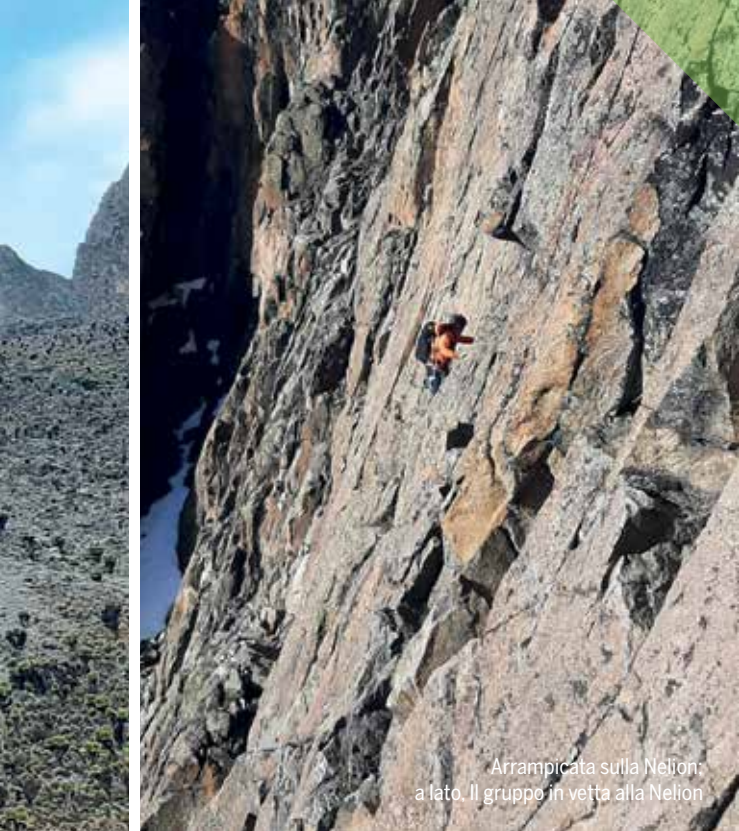
Arrampicata sulla Nelion: a lato. Il gruppo in vetta alla Nelion