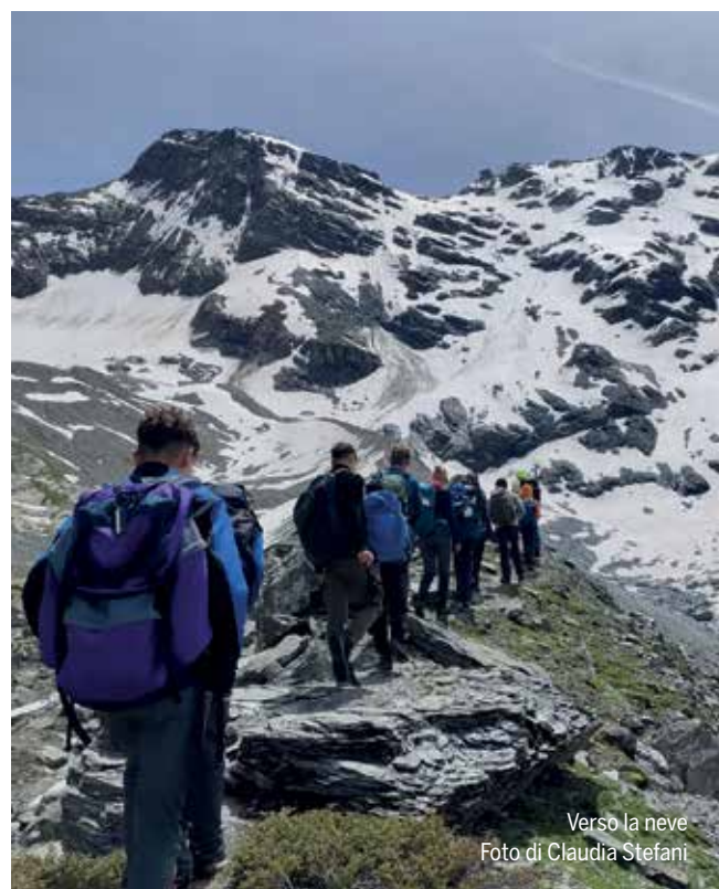
Verso la neve

Dagli anni Ottanta l'attività è stata rinominata Alpinismo Giovanile. Escursionismo, arrampicata, speleologia, bici: sono tutti modi, cadenzati in uscite giornaliere mensili, per far conoscere ai giovani fra i 7 e i 18 anni la montagna e le attività che si possono fare con il Club Alpino.