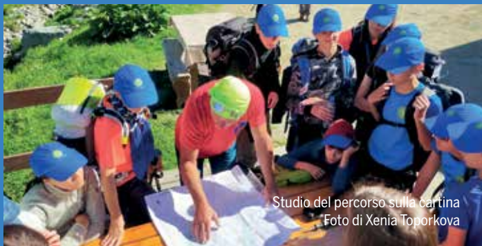
Studio del percorso sulla cartina

Questa è un'esperienza che da più grandi ci verrà in mente, con la nostalgia e la voglia di rivivere ogni momento trascorso. Il gruppo per me è una famiglia che ti supporta nei momenti in cui ti senti sprofondare, rassicurandoti e facendoti ridere, per questo gli accompagnatori del CAI, oltre ad insegnarti il rispetto per la montagna e tutte le sue regole, ti insegnano a vivere in armonia. (Raoul)