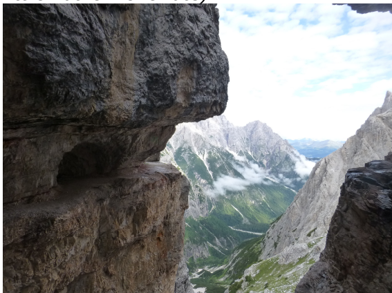
La Strada degli Alpini (Dolomiti di Sesto)

Il Corso si propone di trasmettere le nozioni culturali, tecniche e pratiche per sapere organizzare in autonomia e in sicurezza escursioni di difficoltà E, EE e EEA (Percorsi Attrezzati e Vie ferrate)